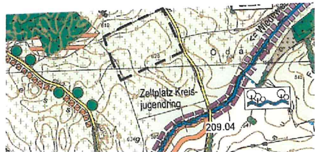
Änderungsbereich Mitte - Sportplatz