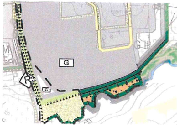
Änderungsbereich Süd - Gewerbepark Westerhof