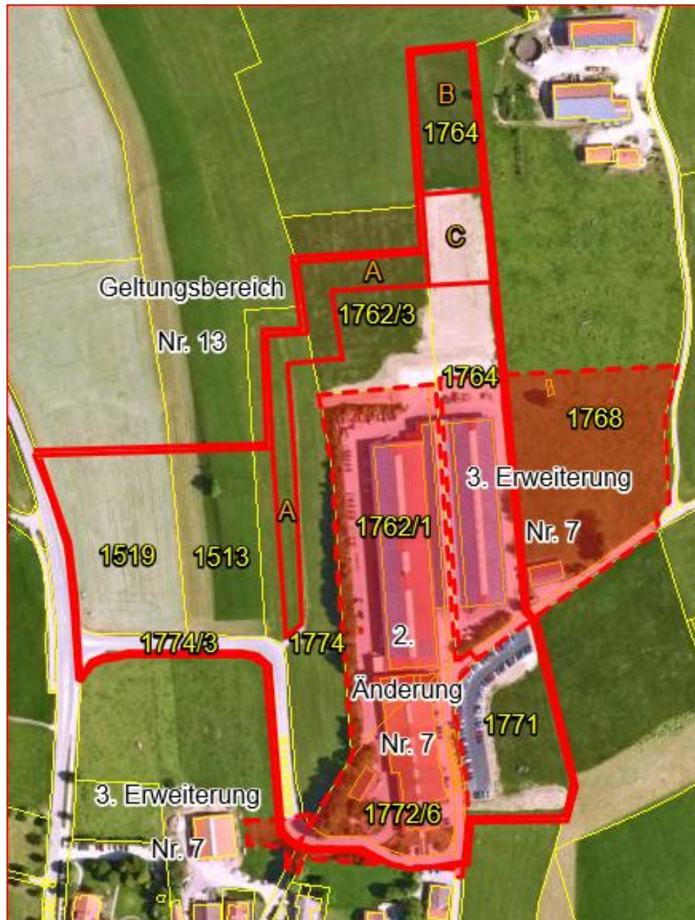
Ökologische Ausgleichsflächen A, B, C

intensität dar (GRZ), die in vorliegender Planung teilweise erhöht und teilweise verringert wird. Die bislang rechtswirksamen ökologischen Ausgleichs- und Ersatzflächen und Maßnahmen werden in die gegenständliche Fassung übernommen.