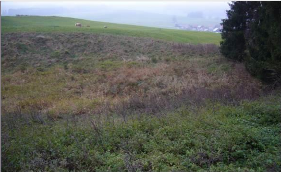
Blick in das Toteisloch von Norden, im Vordergrund die brennesselreiche Ruderalflur, in der Mitte die Rohr-Glanzgrasflur, auf der Böschung im Hintergrund der Altgrasbestand

Der Ausgleich für die Erweiterung des Bebauungsplans erfolgt auf dem Flurstück Nr. 688 der Gemarkung Rettenbach.